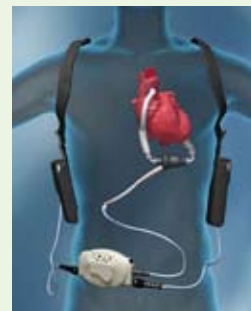
HeartMate® II LVAS

En hjärttransplantation är en bra behandling för patienter med svår hjärtsvikt och resultaten är mycket goda. Patienterna kan oftast återgå till ett normalt liv med bra livskvalitet. Inom ett år efter transplantationen är 75% av patienterna åter i arbete eller studier. När det gäller yngre patienter är den siffran cirka 90%.