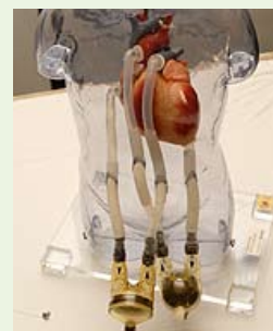
Berlin Heart Excor®