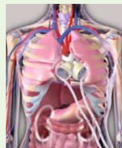
CardioWest™ Total Artificial Heart

Du hittar aktuell statistik om transplanterade organ på www.donationsradet.se .